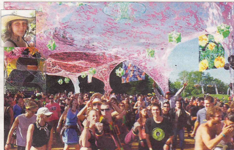
Sous le soleil de Lans-en-Vercors, au "Hadra Trance Festival", édition 2010.

"L'été dernier, le duo Astral Projection - des artistes israéliens qui tournent depuis plus de 20ans, précurseurs de la Trance - ont fait un live explosif qui a enflammé le dance-floor un dimanche matin, et ils nous ont félicités pour notre organisation et la qualité de notre festival".